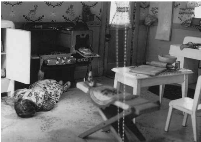
「台所」(ケース Wednesday, April 12, 1944)