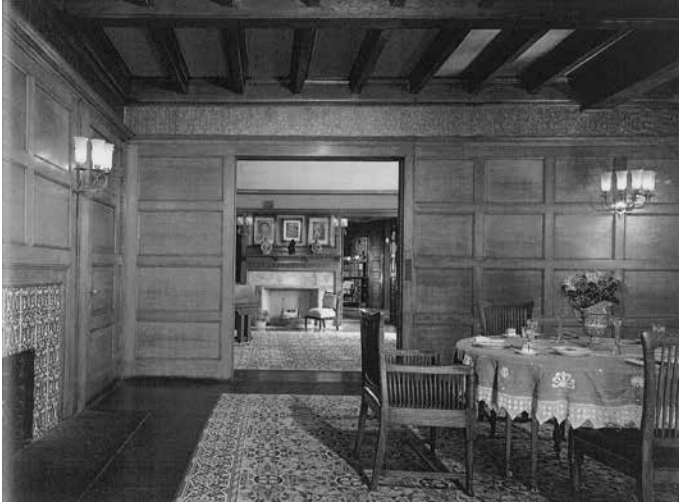
ダイニング・ルームからパーラー，図書室を見渡す Harrington and Hendrich-Blessing, p.43.