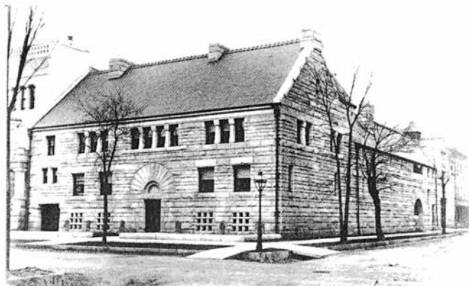
East facade of Glessner House, ca. 1888

入り口を入り、風除けのための階段を上ると、回りが見渡せるホールに着く。上に続くその階段の上までも見渡せる開放感だ。目立たないが、特筆す