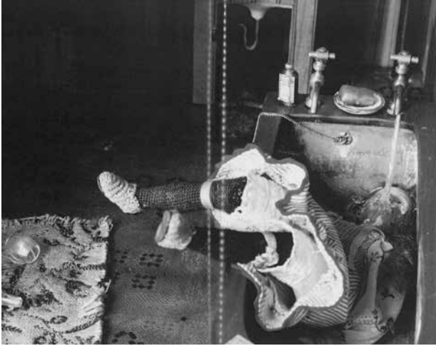
「ダーク・バスルーム」(ケースNov. 6, 1896)

Corinne May Botz, The Nutshell Studies of Unexplained Death , p.89.