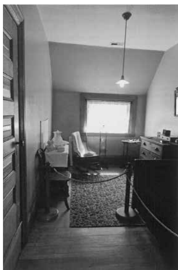
召使部屋