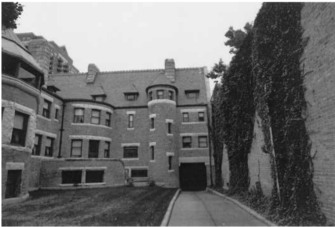
グレスナー邸中庭

外壁だけではない、内装もダイニング・ルームやパーラーには、黄色の天井、壁紙が使われ、ガラスで取り込んだ外の光を柔らかくに反射する効果が期待された。またウィリアム・モリスの特徴である、植物柄は冬の枯れた自然を補うために、溢れんばかりの花柄や緑を再現するものが使われた。無駄な装飾を排し、日常的に用いることを旨として、選択眼がいかされた 22) 。