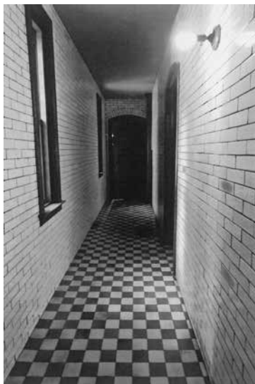
サービス廊下