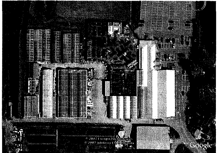
写真4 100年あまりの歴史を持つH社。ばらの育種も行っている。売り場は写真の右半分。右手、温室兼用の売り場は増築で面積が3倍になった。

ガーデニングが園芸と同義ではないことは、1990年代中葉以降の、ガーデンセンターの量的・質的な拡大からも見てとることができる。すでに各種のガーデングッズ（アイテム）が日本にも紹介、輸入されはじめているから個々の例は挙げないが、チーク材や合金製の長いすやテーブル、バーベキューテーブルなどのために、種苗や（従来からの）園芸用品売り場とは別に広い売り場を設け、自作用のフェンス資材やガーデンデッキ材料まで多数取り揃えて販売しているガーデンセンターを見ると、もはやこうした店舗を「大型園芸店」と呼ぶことは適切でないように思われるのである。私の行きつけのガーデンセンター2社の、近年における拡大ぶりをご覧いただきたい(写真4、5)。