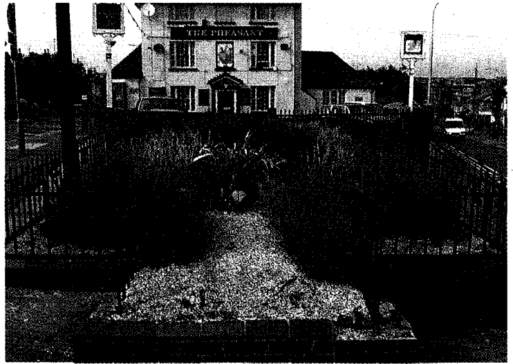
写真8 車道にはさまれた公共花壇。ラベンダーなど乾燥に強い植物を選び、砂利を厚く敷いて雑草を押さえている。

いるのかもしれない。この地域では2006年の夏もまた、ホース灌水が禁止された。スプリンクラーはもちろんご法度。『園芸家十二か月』を引くまでもなく、芝生が枯れ上がってしまったボーダーは、見よいものではない。