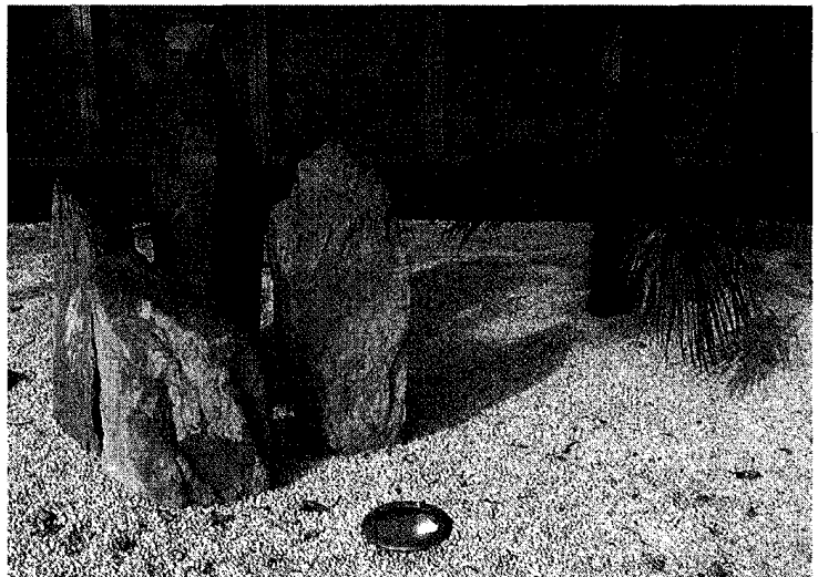
写真7 レディング駅脇のオフィスビルの道路側に、2000年紀の到来を記念して作られたメンテナンス・フリーの「石庭」。これにZENを感じる英国人がいるのかもしれない。2006年9月

人に、新たなもの、珍しいものへの欲望がある限り、国境を越えた文化交流は必然であり、その過程で、誇張や選択、それに思い違いはつきものだろう。優れて文化的な営為であるガーデニングも、その例外ではなさそうである。