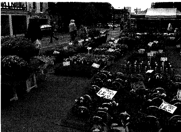
写真1 市場の花屋。2006年9月の撮影。15年前に比べるとはるかに規模が大きくなっている。

第四に、老舗デパートH社の地階。しかし、ここはタネものと袋詰め 袋詰め の宿根草苗、球根に園芸用具、機材程度で、それほど魅力的ではなかった。ガーデンチェアなどは各種取り揃えてあったが、鉢物は置かれていなかった。