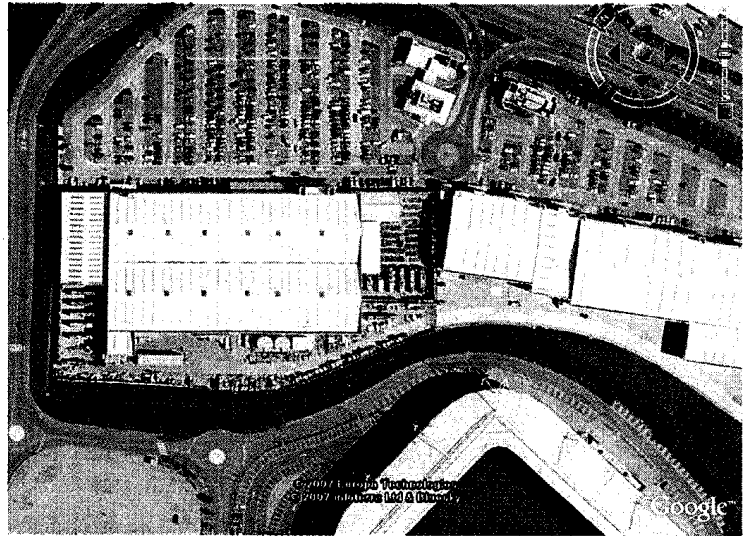
写真3 左側の建物がB社の現店舗。中央に屋外売り場、その左が温室。店内でも芝刈り機をはじめ園芸用品を大量に販売している。右下はサッカースタジアム

の労働者はガーデニングを楽しむゆとりを持ち合わせていなかった。サッチャー首相の持ち家政策は、労働者階級の意識の中流化を進めた 9 。家の資産価値をさらに上げるために、コミュニティ意識を高め、街区のイメージを向上させる手段として、一歩進んだ、地域総出によるコミュニティガーデンづくりも、政策的に奨励されている 10 。