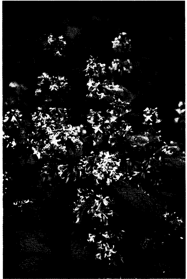
図2 Clematis heracleifolia var. davidiana 直立性のクレマチスで、8月から9月のボーダーで存在感がある。その季節にはなくてはならない花となっている。

夏から秋にかけて咲きそろうのが C. viticella 、 C. x jackmanii 、 C. rehderiana 、 C. orientalis 'Bill MacKenzie' である。 C. viticella は地中海沿岸原産で古くからイギリスでも栽培され、traveller's joy (旅人の楽しみ) という英名が付けられるほど人々に親しまれてきた。現在でも7月から8月にかけて、4弁の赤や紫の花が建物の壁づたいとか、ボーダーのスタンダード作りにされて数え切れないほどたくさんの花をつける。イギリスの庭園には欠かせない