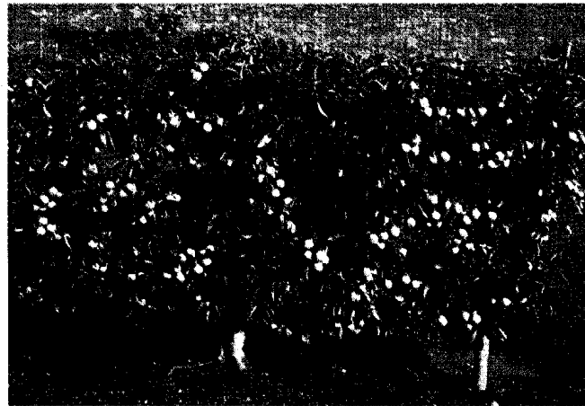
図2 イギリス East Malling の The Hatton Garden の人工形整枝樹 上 Espalier (Arches 形) に整枝されたリンゴ樹 中 Espalier (Fan 形・扇) に整枝されたリンゴ樹 下 Espalier (Horizontal Palmett ・水平パルメット) に整枝されたリンゴ樹