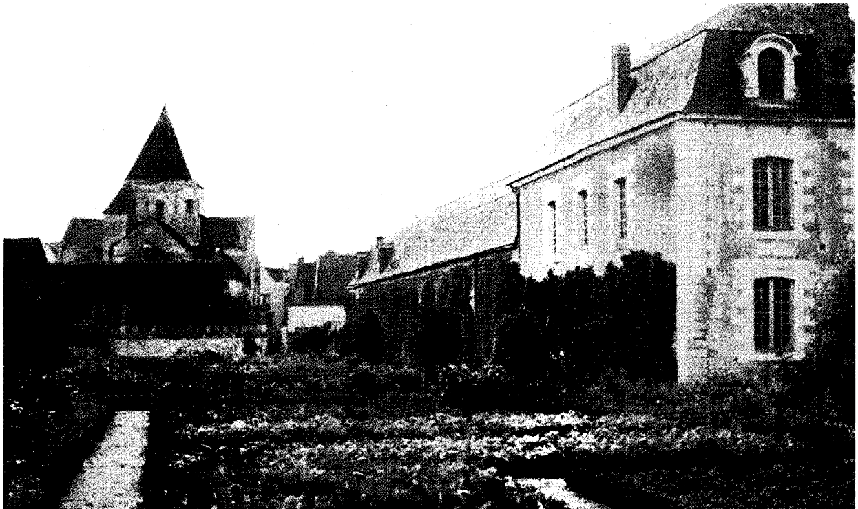
図1 欧州における中世のお城の庭園(フランス・ロワール地方) 幾何学模様の低い生け垣が典型。Kitchen Garden (Fruit Garden) が含まれる。壁に沿った Espalier 仕立ての果樹類など。

Planting of fruit trees in Gardening begun by the usage of dwarfing rootstocks and artificial tree training methods like Espalier. Traditional artificial tree training methods and fruit gardens are represented by the Jardin du Roi in Versailles. Sir Donard Hatton selected and named the dwarf rootstocks for apples and pears at the East Malling Research Station. He built the Hatton Garden in Bradbourne house nearby the East Malling Rsearch Station to keep alive the traditional forms of fruit trees trained artificially. On a way developing the styles of gardening in England, the fruit garden has been adopted.